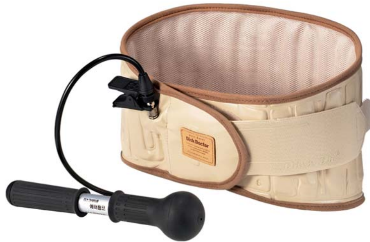
Fascia per trazione vertebrale