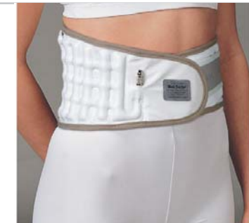
Cintura gonfia (Vista anteriore)