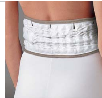
Cintura sgonfia (Vista posteriore)

L'ortesi aderisce bene al corpo seguendo perfettamente il profilo lombare, assicurando vestibilità perfetta. La fascia può essere utilizzata direttamente dal paziente a casa, al lavoro, alla guida e durante il tempo libero.