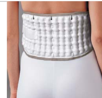
Cintura gonfia (Vista posteriore)